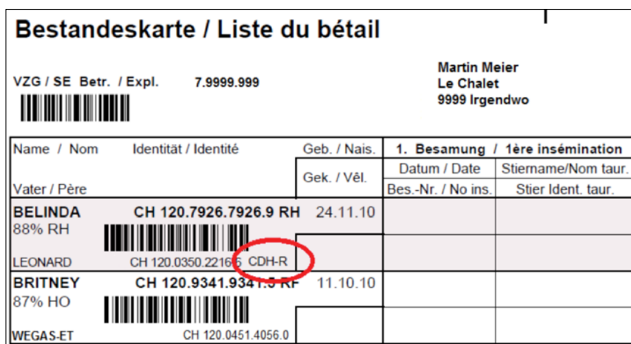
Illustration : Les vaches à risque seront marquées par CDH-R sur les listes de bétail.