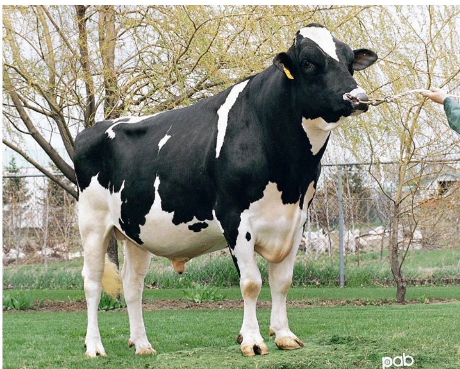
Maughlin STORM a introduit la mutation et l'haplotype dans la population.

A l'âge de 21 jours à 6 mois, ces animaux attrapent une diarrhée incurable qui conduit normalement à la mort. Un groupe de chercheurs allemands a découvert qu'il s'agit d'un problème génétique récessif. Un certain haplotype, un morceau de matériel génétique comportant un gène inconnu jusqu'ici, en est responsable. Le tableau clinique est causé par une mutation dans ce gène non encore découverte à ce jour. Par conséquent le test ne peut être fait qu'indirectement avec des haplotypes. Comme les veaux malades n'ont pratiquement pas de cholestérol dans le sang, cet haplotype a été nommé haplotype déficit en cholestérol ou CDH.